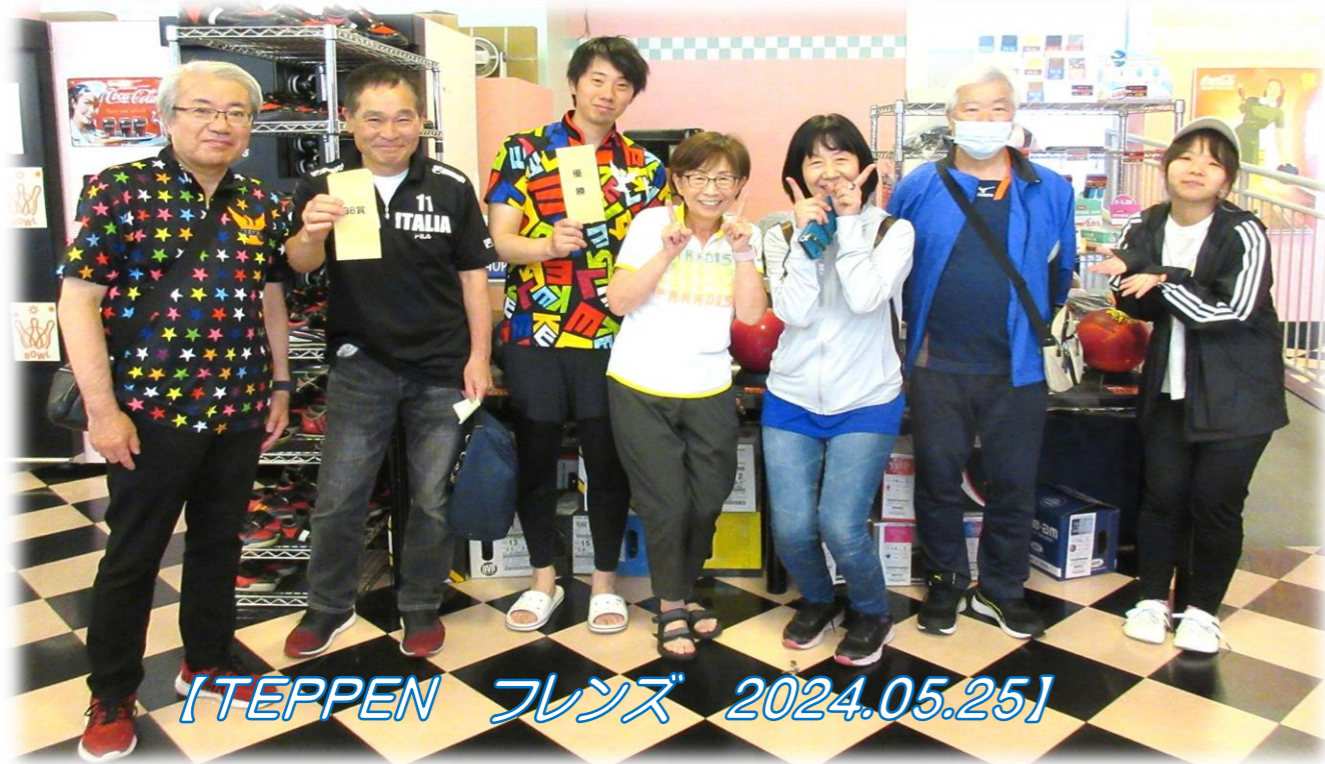
【TEPPEN フレンズ 2024.05.25】